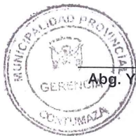
Abg. Yahaira Ysabelita PLASENCIA ZEVALLOS